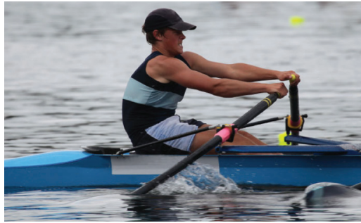
உரு 4.10 துடுப்பின் மூலம் நீரின் மீது விசையைப் பிரயோகித்தலும் அதற்குச் சமமான ஒரு விசையை நீர் மூலம் படகின் மீது செலுத்துதலும்

ஒரு படகை வலிக்கும்போது துடுப்பின் மூலம் நீரின் மீது விசை பிரயோகிக்கப்படுகின்றது. (உரு 5.0) துடுப்பினால் நீர் நிரலின் மீது பிரயோகிக்கப்படும் விசைக்குச் சமமான ஒரு விசை நீரினால் படகு மீது பிரயோகிக்கப்படுகின்றமை இதிலிருந்து தெளிவாகும்.