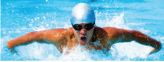
உரு 4.11 இரு கைகளினாலும் நீரின் மீது விசையைப் பிரயோகித்தலும் அதற்குச் சமமான விசையை நீரினால் உடலின் மீது பிரயோகித்தலும்

இங்கு நீந்தும் போது இரு கைகளினாலும் பின்னோக்கிப் பிரயோகிக்கப்படும் விசை தாக்கமாகும். உடலின் மீது நீரினால் முன்னோக்கி ஒரு விசை பிரயோகிக்கப் படுதல் இத்தாக்கத்தின் மறுதாக்கம் ஆகும்.