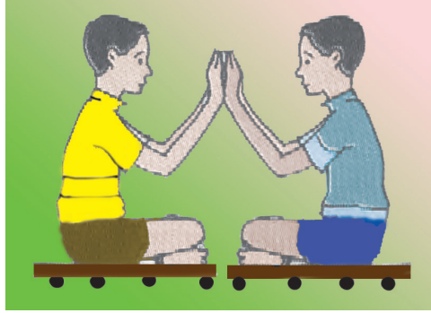
உரு 4.9 உள்ளங்கை மீது உள்ளங்கையை வைத்துத் தள்ளும்போது இரு பிள்ளைகளும் எதிர்த் திசைகளில் தள்ளப்பட்டுச் செல்லல்

சில மாபிள்களின் மீது இரு பலகைத் துண்டுகளை வையுங்கள். இவ்விரு பலகைகளின் மீது இருவர் அமர்ந்திருத்தல் வேண்டும். உரு 4.9 இற் காட்டப்பட்டவாறு உள்ளங்கை மீது உள்ளங்கையை வைத்து ஒருவரை ஒருவர் தள்ளும் போது இருவரும் எதிர்த் திசைகளில் தள்ளப்படுதேக் காணலாம்.