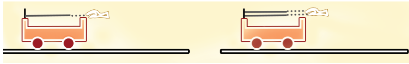
உரு 4.6 ஒப்பமான கிடை மேசை மீது துரொல்லியின் இயக்கம்

நியூற்றனின் இரண்டாவது விதியை விளக்குவதற்குப் பின்வரும் உதாரணத்தைப் பார்ப்போம்.