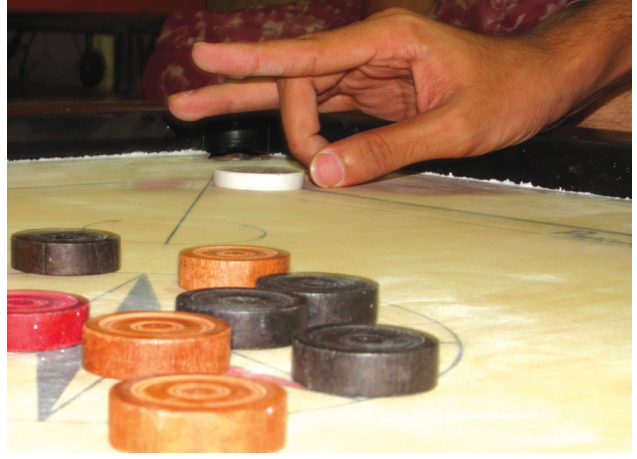
உரு 4.4 கரம் பலகை

ஒரு கரம் பலகை மீது இருக்கும் ஒரு கரத் தட்டை (Disk) விரல் நுனியினால் தட்டும் போது அது ஒரு நேர்கோடு வழியே சிறிது தூரத்திற்குச் சென்று ஓய்வுக்கு வருகின்றது. கரம் பலகையில் சிறிதளவு பூசல் மாவை இட்டுத் தேய்த்த பின்னர் கரத் தட்டை மறு படியும் முதலில் செய்தவாறு விரல் நுனியினால் தட்டும் போது கரத் தட்டு முன்னிலும் பார்க்கக் கூடிய தூரத்திற்குச் செல்கின்றது.