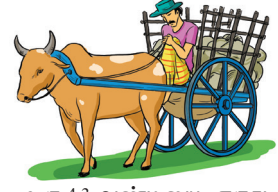
உரு 4.3 வண்டியை எருது இழுத்துக்கொண்டு செல்லல்.

நிறை ஏற்றப்பட்ட ஒரு வண்டியை ஒரு எருதினால் விரைவாக இழுத்துக்கொண்டு செல்லும் ஒரு சந்தர்ப்பத்தைக் கருதுங்கள். வண்டி இயங்கும் திசையில் வண்டிக்காரனும் ஒரு விசையைப் பிரயோகித்தால், என்ன நடைபெறும்? வண்டி இயங்கும் வேகம் அதிகரிக்கும். வண்டி இயங்கும் திசைக்கு எதிரான திசையில் ஒரு விசையைப் பிரயோகித்தால், அதன் வேகம் குறையும்.