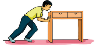
உரு 4.1 மேசையைத் தள்ளுதல்

ஒரு மேசைக்கு ஒரு விசையைப் பிரயோகித்துத் தள்ளிப் பாருங்கள். அது இயங்க ஆரம்பிக்காவிட்டால், பிரயோகிக்கும் விசையை படிப்படியாக அதிகரித்துத் தள்ளிப்பாருங்கள். இவ்வாறு விசையை அதிகரிக்கும் போது ஒரு சந்தர்ப்பத்தில் அது இயங்க ஆரம்பிக்கும். அதாவது ஒரு பொருளை இயங்கச் செய்ய குறைந்தபட்ச விசை ஒன்று பிரயோகிக்கப்பட வேண்டும்.