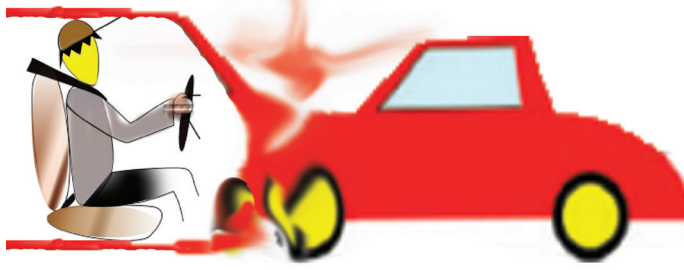
உரு 4.5 ஆசனப் பட்டி அணிந்துள்ள சாரதி

மோட்டார் வாகனங்களில் செல்லும்போது தடுப்புகளைப் பிரயோகிக்கையில் முன்னோக்கி வீசப்படுவதைத் தடுப்பதற்கு ஆசனப் பட்டி (Seat belt) அணிதல் அவசியமாகும்.