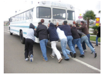
உரு 4.2 பேருந்துதைத் தள்ளுதல்

மேசையைத் தள்ளியது போன்றே நீங்கள் தனியாக பேருந்துதைத் தள்ளுமிடத்து அது அசையாது. எனினும் உரு 4.2 இல் காட்டியவாறு ஒரு குழுவாகத் தள்ளும் போது அது அசைய ஆரம்பிக்கும். அதாவது பிரயோகிக்கும் விசையை அதிகரிக்கும் போது அது அசைய ஆரம்பிக்கும். இவ்விரு சந்தர்ப்பங்களின் போது பொருளை இயங்கச் செய்வதற்காக பிரயோகிக்கும் விசை அவ்வியக்கத்துக்குத் தடையாயுள்ள யாதாயினும் விசையை விஞ்சும் போது அப்பொருள் இயங்க ஆரம்பிக்கின்றது. அப்பொருளின் இயக்கத்துக்கு எதிரான தடைவிசையே உராய்வு விசையாகும். நாம் பிரயோகிக்கும் விசை சிறியதாயின் அவ்விசை எதிர்த் தொழிற்படும் விசையுடன் சமநிலையடையும். இதன்போது பிரயோகிக்கும் தேறிய விசை பூச்சியமாவதால் பொருள் இயங்காது. பொருளை